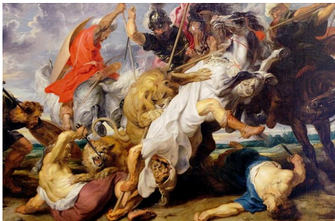
Охота на львов

В этот период своего творчества Рубенс демонстрирует жизнеутверждающую силу барокко, основу которого составляют динамизм, чувственность и декоративность.