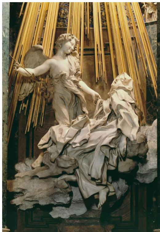
Экстаз святой Терезы