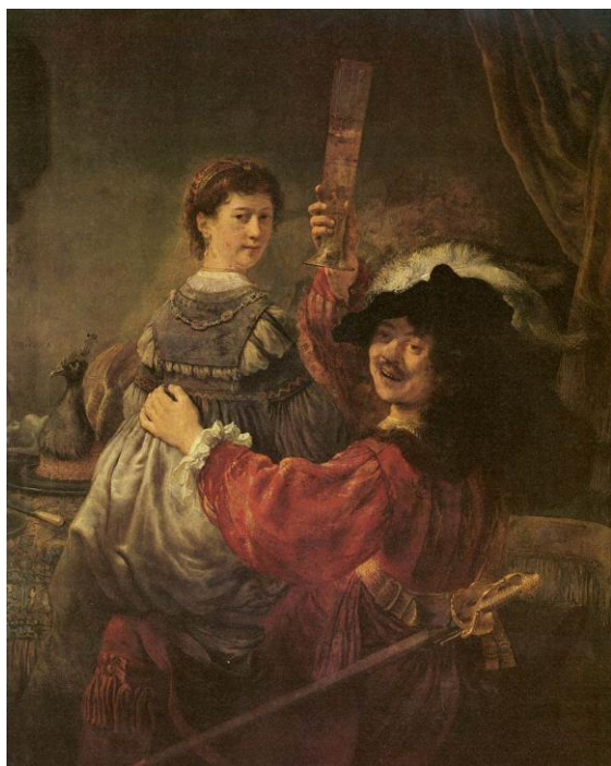
Автопортрет с женой Саскией

Рембрандт открывает новые возможности светотени, с помощью которой не только подчеркивает объём и форму, но и задаёт эмоциональную тональность картинам.