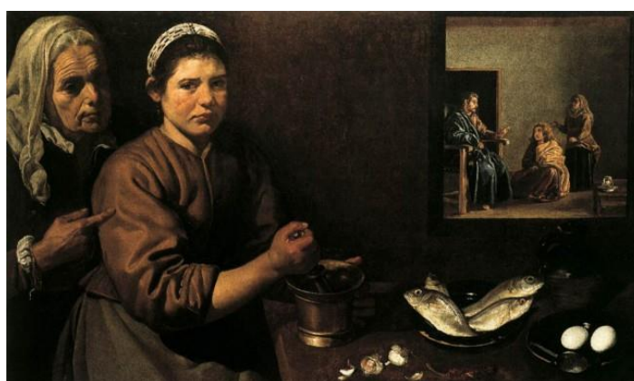
Христос в доме Марии и Марфы