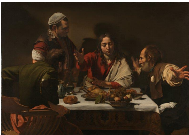
Ужин в Эмаусе

Для картин Караваджо характерна реалистичность вплоть до отталкивающего натурализма, изображение библейских героев в одежде и обстановке своих современников. В картинах Караваджо впервые возникает особое освещение (техника «тенебресо» - от итал. «мрачный», «тёмный»), что позволяет делать фигуры объёмными, выразительными и реалистичными за счёт резкого контраста с тёмным фоном и погружёнными во мрак деталями.