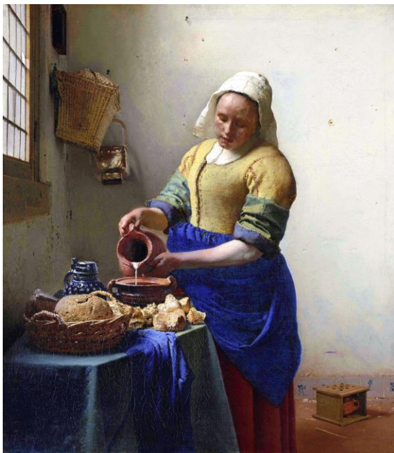
Служанка с кувшином молока

Мастер бытового жанра, он очень точно передавал уют голландского дома, большое внимание уделял передаче световоздушной среды.