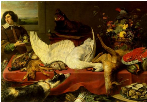
Натюрморт с лебедем

Мастер монументального и декоративного натюрморта, который изображает необычайное изобилие сочных фруктов и овощей, а также всевозможной битой дичи, морской и речной рыбы.