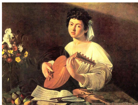
Юноша с лютней