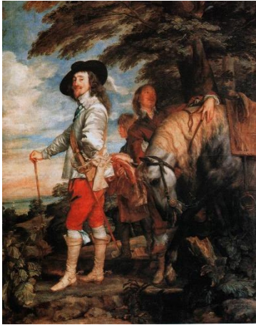
Портрет Карла I на охоте