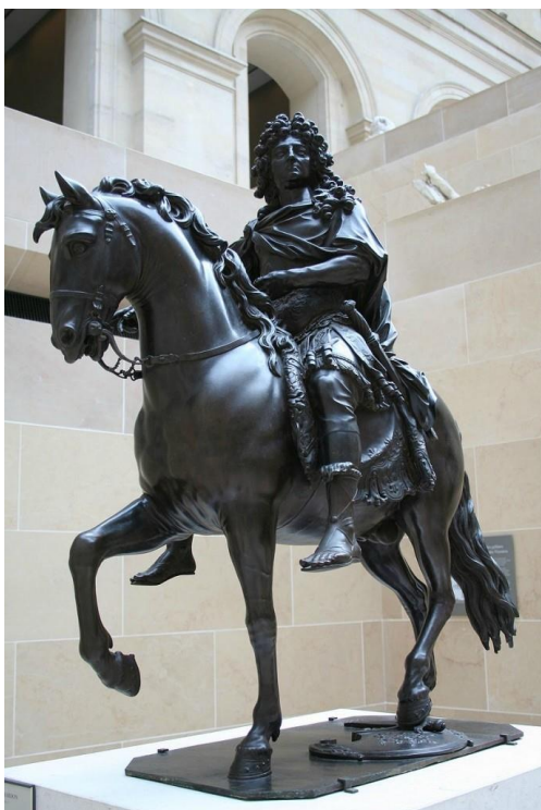
Конная статуя Людовика XIV