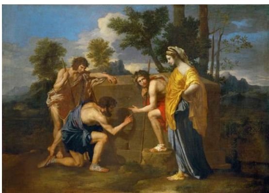
Аркадские пастухи. 1650г.

Считается наиболее выдающимся художником французского классицизма. Он стремился к созданию гармонии на своих полотнах.