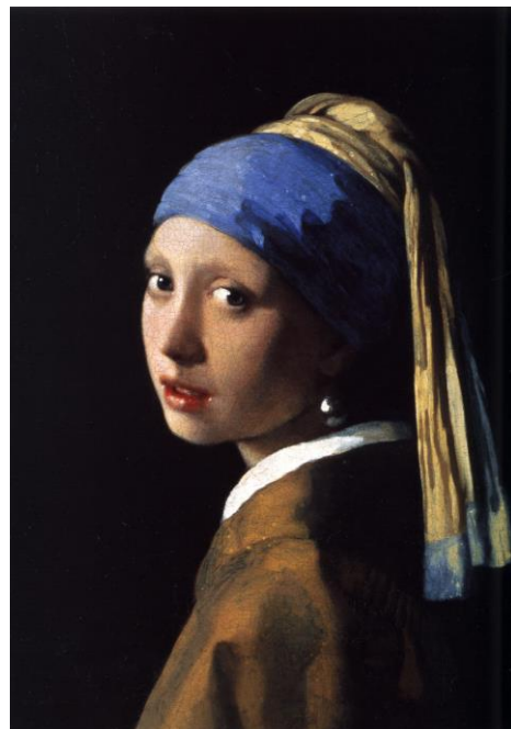
Девушка с жемчужной серёжкой